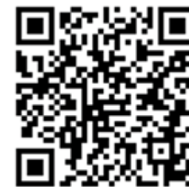
Акция «Дари добро»

Предлагаем по возможности активно подключиться к акции «Дарю добро», предварительно ознакомившись с правилами проведения данной акции, пройдя по QR коду.