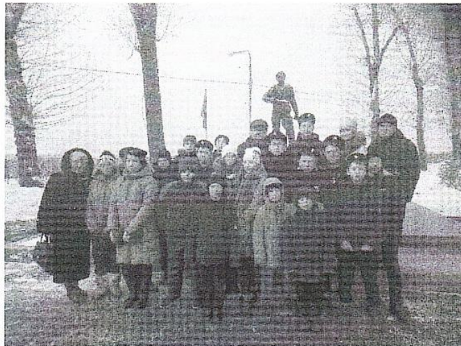
Возложение цветов к мемориалу «Вечный огонь» г. Иркутск