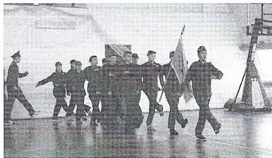
Выступление на Дне пограничника г. Усолье-сибирское.