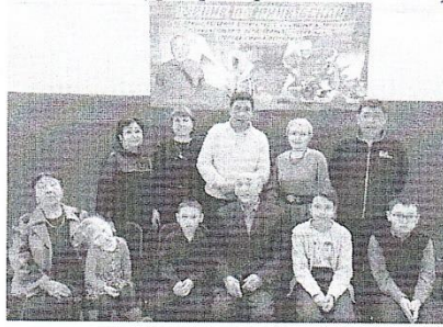
Районный турнир по ринк-бенди на призы ветерана спортивного движения Егорова Е.П.