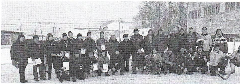
Эстафета ко Дню Победы